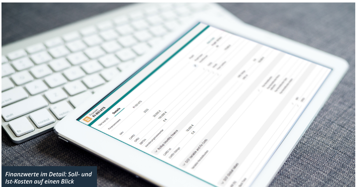
Finanzwerte im Detail: Soll- und Ist-Kosten auf einen Blick